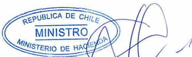
NICOLÁS GRAU VELOSO MINISTRO DE HACIENDA

"POR ORDEN DEL PRESIDENTE DE LA REPÚBLICA"