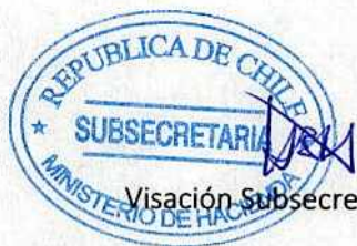
Visación Subsecretaría de Hacienda