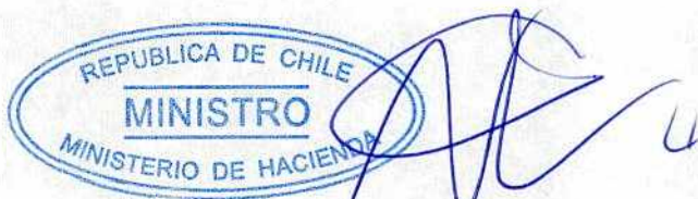
NICOLÁS GRAU VELOSO MINISTRO DE HACIENDA

"POR ORDEN DEL PRESIDENTE DE LA REPÚBLICA"