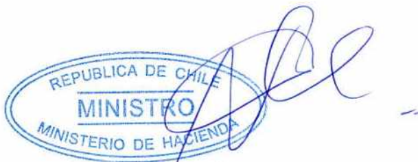
NICOLÁS GRAU VELOSO MINISTRO DE HACIENDA

"POR ORDEN DEL PRESIDENTE DE LA REPÚBLICA"