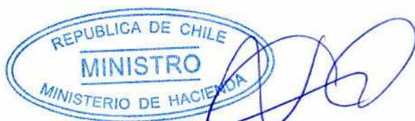
NICOLÁS GRAU VELOSO MINISTRO DE HACIENDA

"POR ORDEN DEL PRESIDENTE DE LA REPÚBLICA"