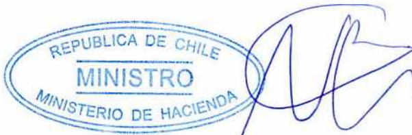
NICOLÁS GRAU VELOSO MINISTRO DE HACIENDA

“POR ORDEN DEL PRESIDENTE DE LA REPÚBLICA”